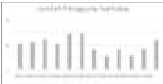
Grafik 1: Perkembangan Jumlah Pengguna Narkoba 2011-2023 di Indonesia

Masalah penyalahgunaan NAPZA atau akronim dari Narkotika, Psicotropika, dan Zat Adiktif mengalami tren peningkatan. Menurut data UNDCP ( United Nations Drugs Control Programme ) tahun 2020, bahwa penyalahgunaan NAPZA atau narkoba di dunia mencapai 284 juta orang. Dari populasi tersebut, 2 juta orang di antaranya ada di Indonesia (Annual Report UNDCP, 2021).